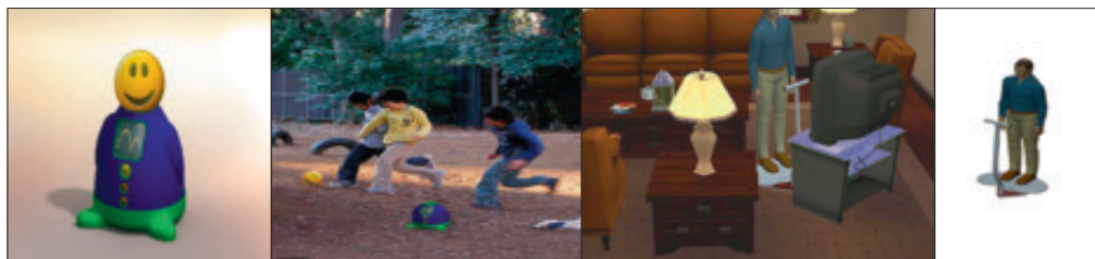
Figur 2. Skitse af "Henny Benny Bolden" og "Balance Board Game".

man kunne spille interaktive spil – og støttehåndtaget gjorde det trygt at bruge det. I designet blev der lagt vægt på at hjælpemidlet skulle være diskret, flytbart og nemt at bruge.